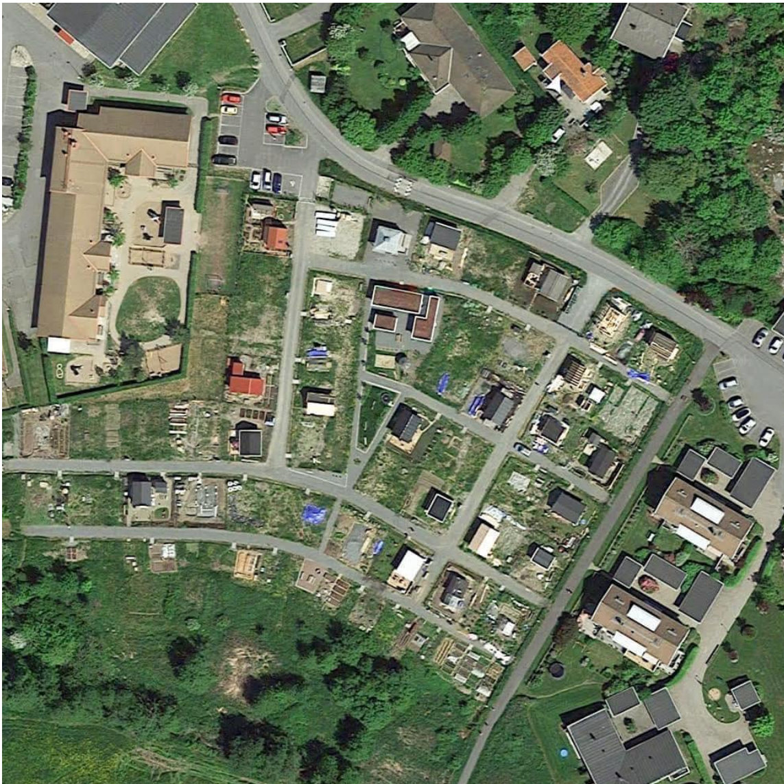
Uggledalens koloniträdgårdar under uppbyggnad sommaren 2021